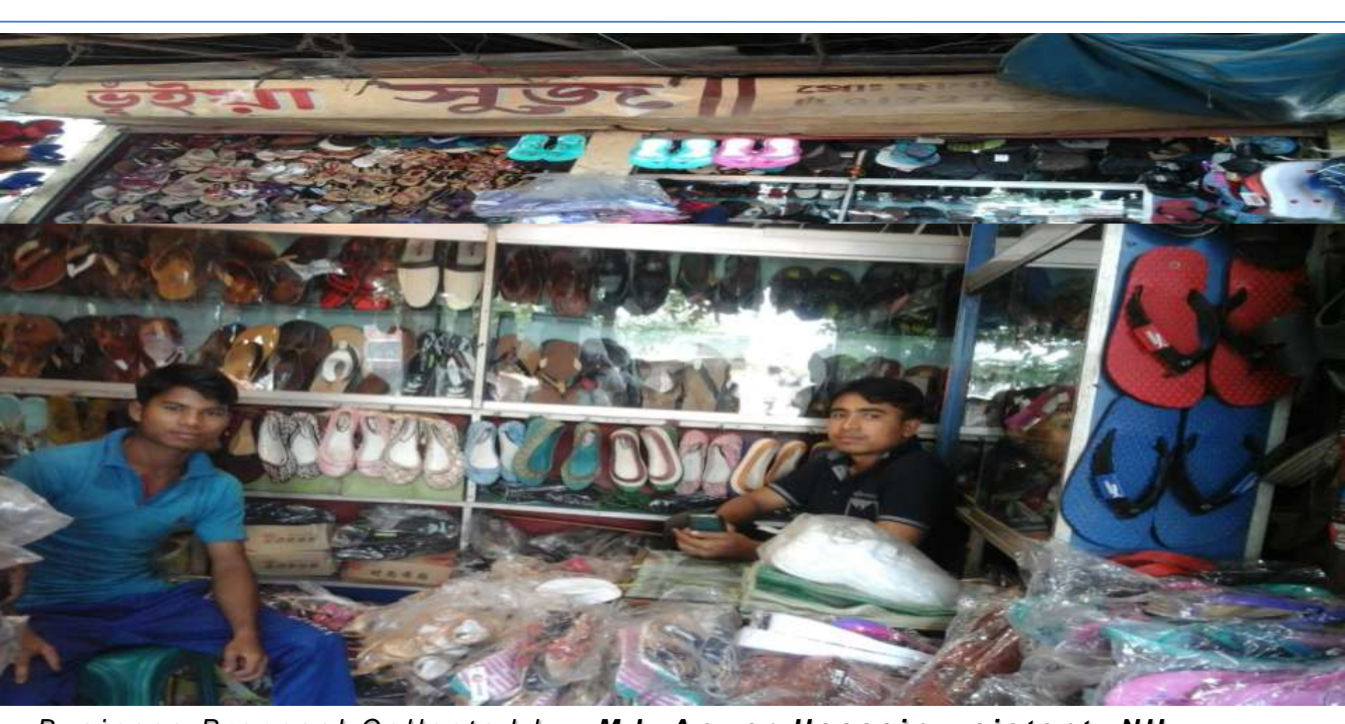
Business Proposal Collected by: Md. Anwar Hossain, sistant NU, Chauddagram, Comilla

Business Category: General Retail & Wholesale