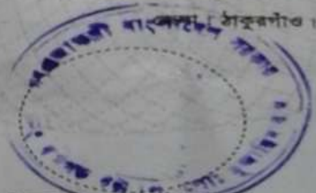
নিবন্ধকের কার্যালয়ের সীলমোহর