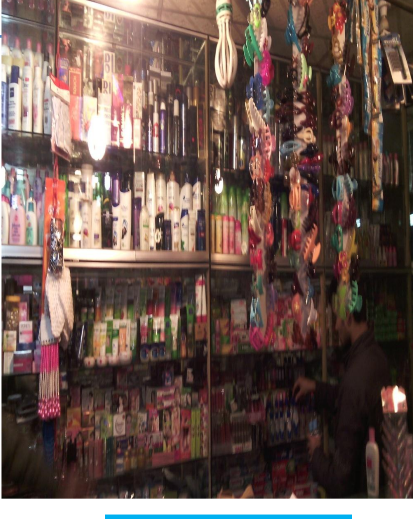
Nu Identified and PP Prepared and Verified by Md. Alauddin (Ramgonj Unit)