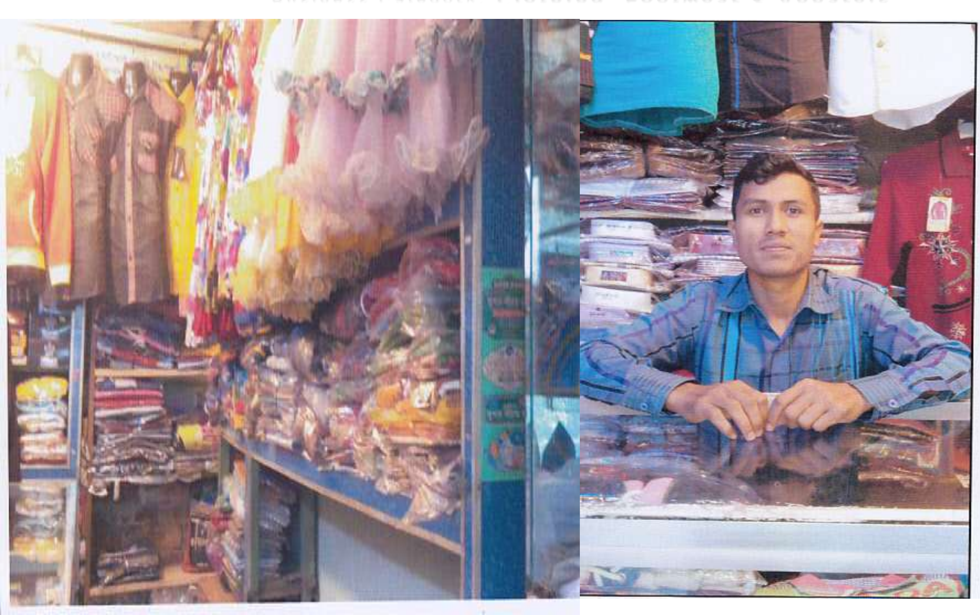
Business Proposal Prepared & Verified by: Naznin Akther

Proposed NU Business Name: Bijoy Collection Business Category: Clothing, Footwear & Apparels