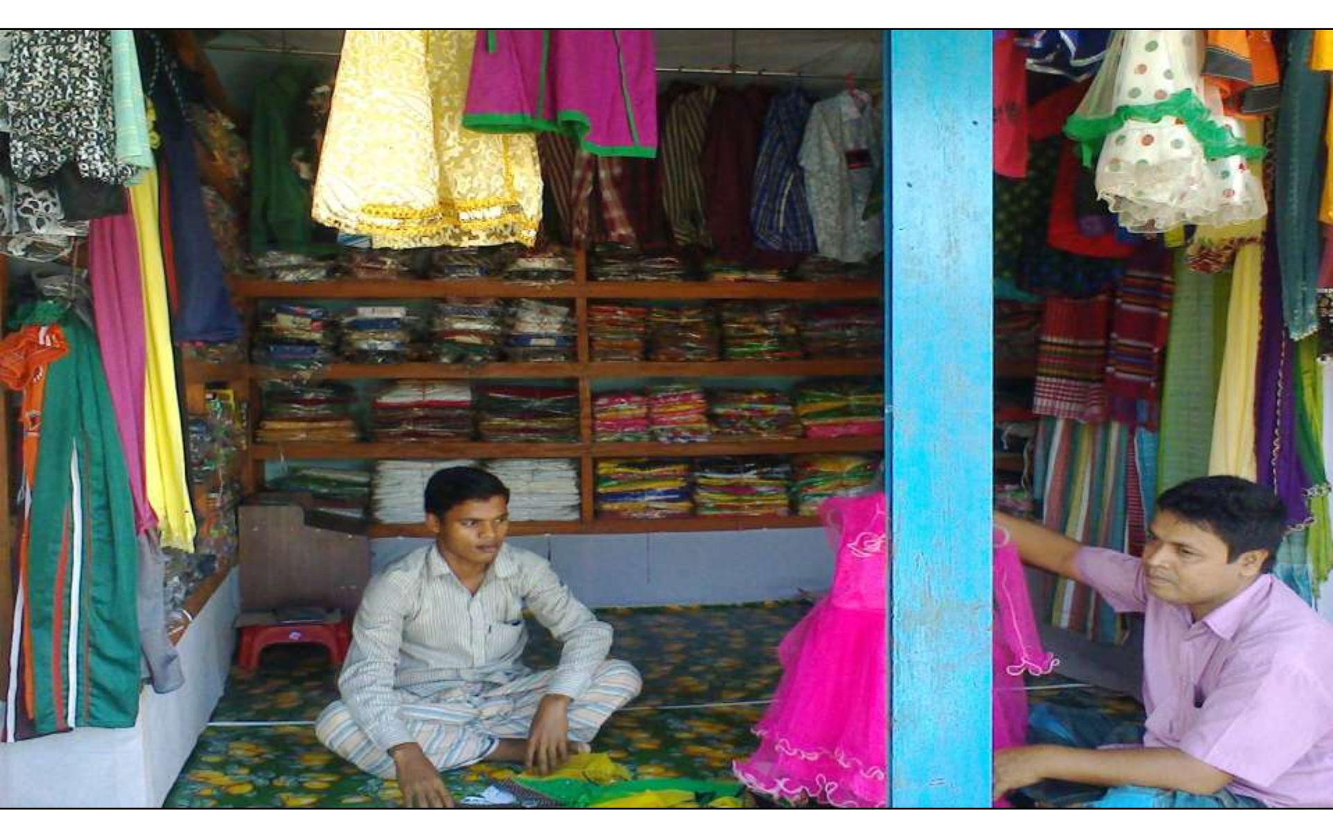
Business Proposal Prepared & Verified by: Fahina Yesmin Happy

Business Category: Clothing, Footwear and Apparels