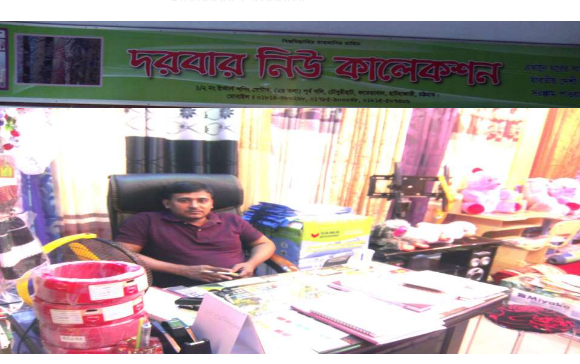
Business Proposal Prepared & Verified by: Shyamal Mitra