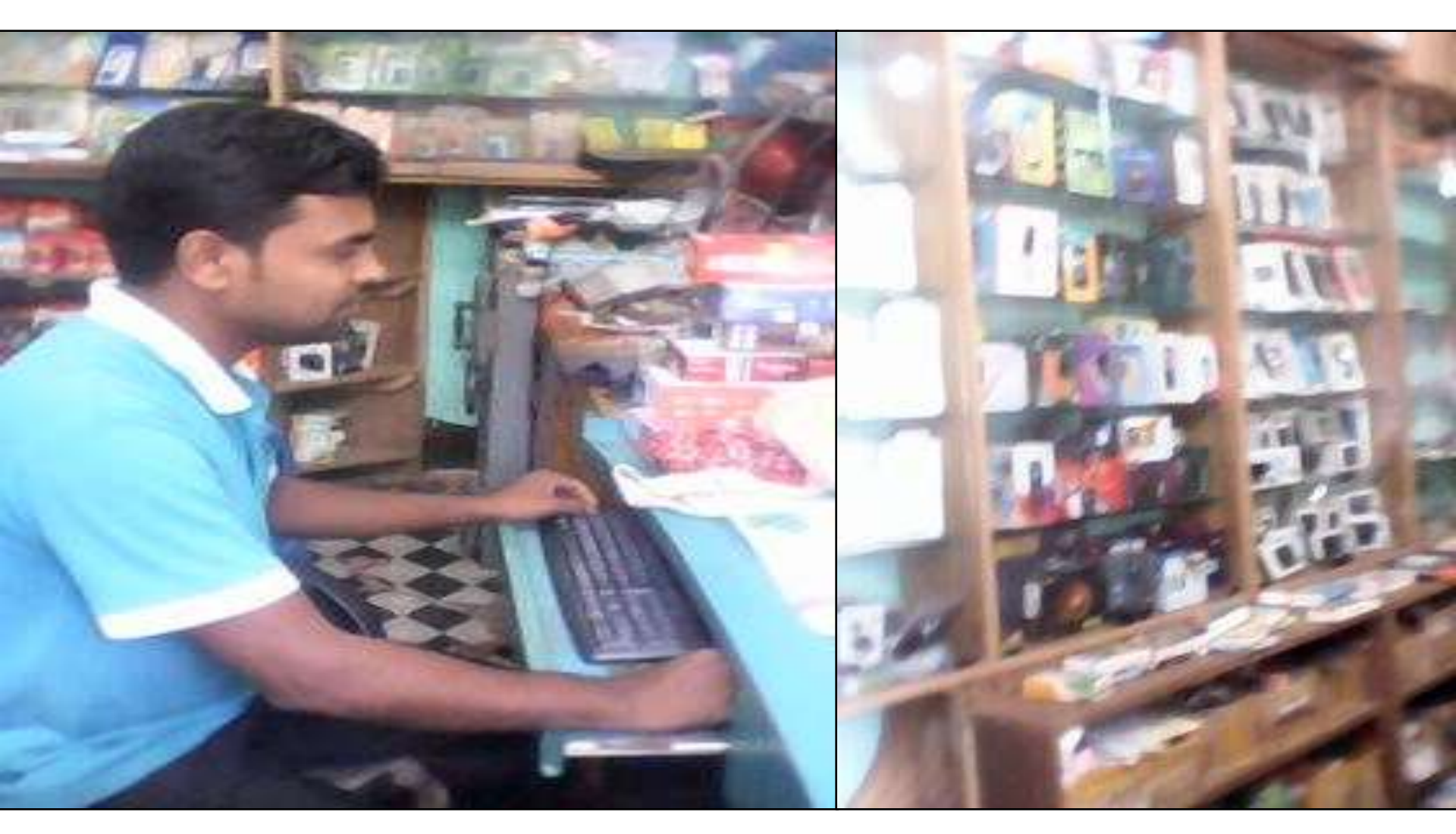
Business Proposal Prepared & Verified by: Fahina Yesmin Happy