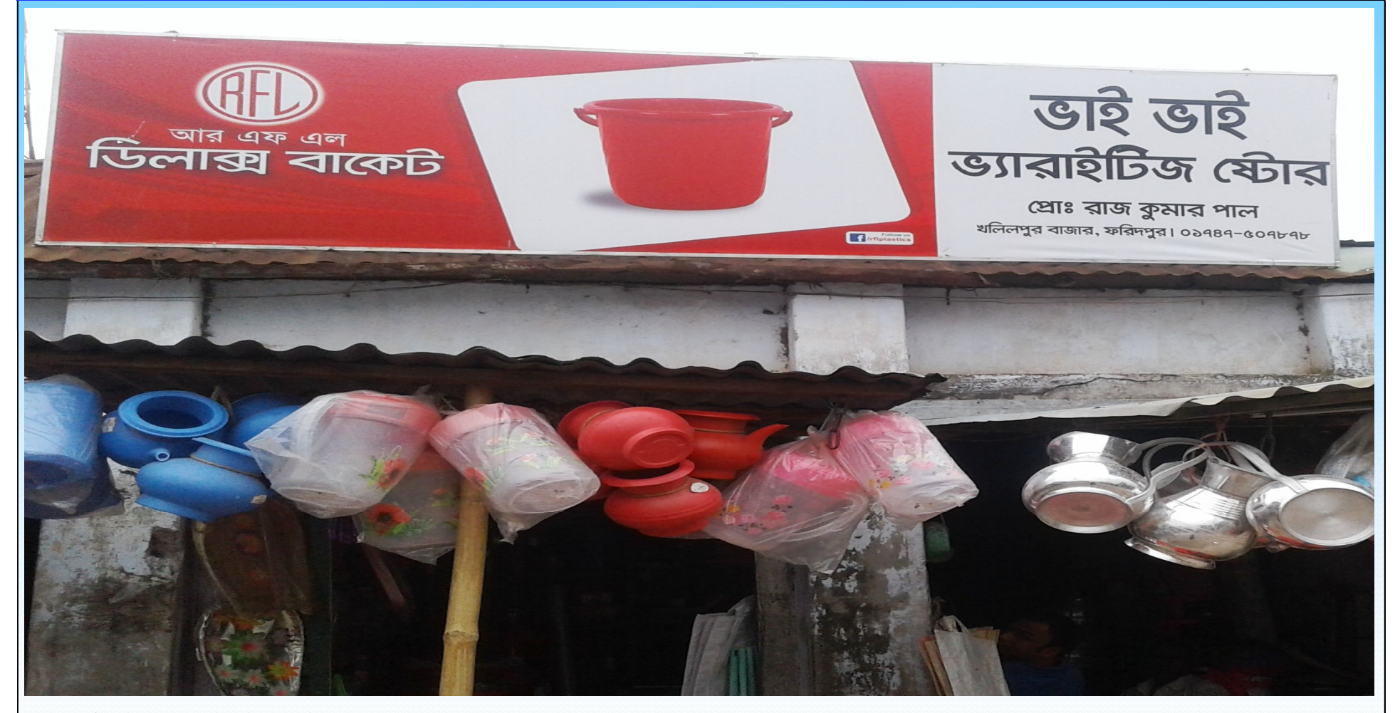
Verified By: Md.Khairul Basar: NU Identified and PP Prepared by : Md. Shahabuddin Islam